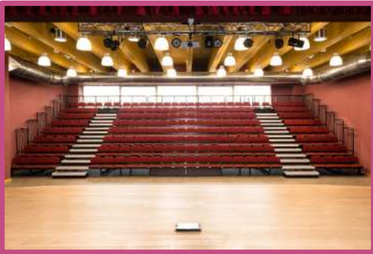
Nueva biblioteca cívica – Arese (Italia)