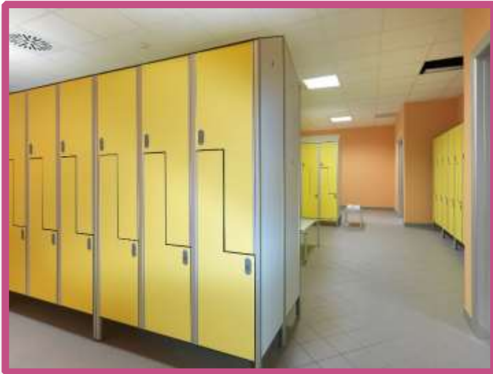
Hospital Niguarda– Milan Vestuarios