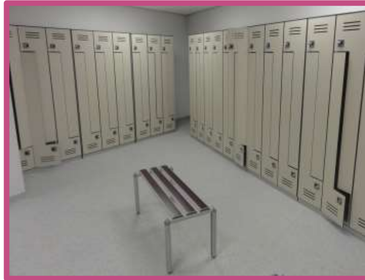
Hospital Heart and Chest Liverpool Vestuarios